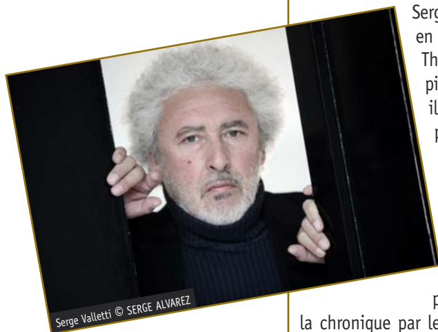
Serge Valletti

Dans Le Dictionnaire encyclopédique du Théâtre , Michel Corvin écrit dans sa présentation de Serge Valletti qu'il est un auteur qui « se souvient qu'il est du sud ».